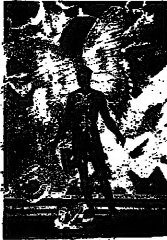
(ابروح ايكاروس) الفنان التشكيلي